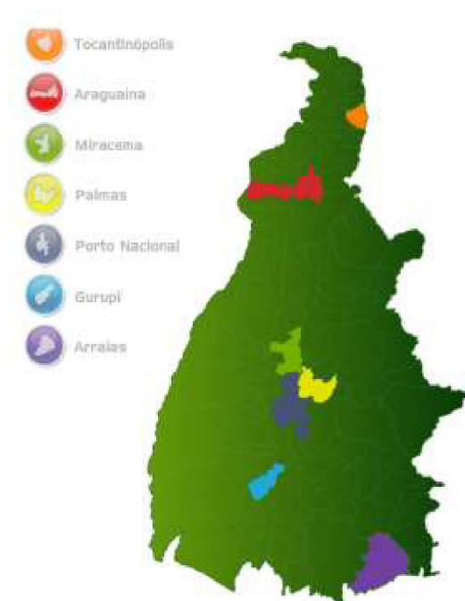
Imagem 1: Mapa do Tocantins com os campi da UFT assinalados

implantados em diferentes cidades (Araguaína, Arraias, Gurupi, Miracema, Palmas, Porto Nacional e Tocantinópolis), conforme figura a seguir: